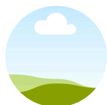
??? Assistante de projet