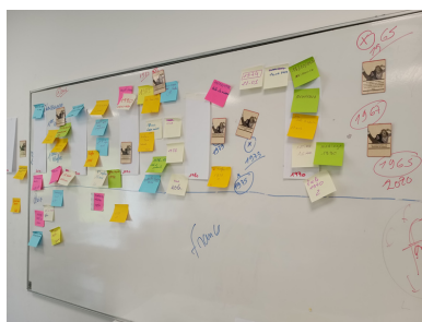
Frise des droits Grandes et petites histoires

Le 16 mai, nous avons assisté à une réunion d'information, de réflexion et d'échanges du Réseau Violences à Confolens.