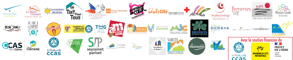
Illustration : corbac40

Retrouvez les points de collecte sur : www.planning-familial.org/fr/le-planning-familial-de-lisere-38